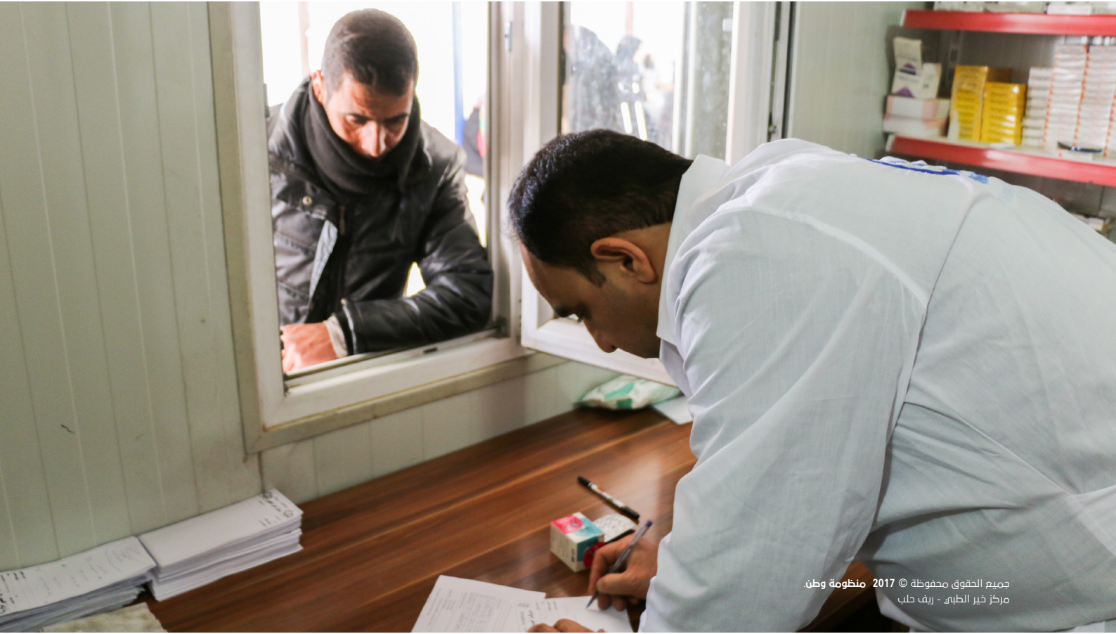
جميع الحقوق محفوظة © 2017 منظومة وطن مركز خير الطبي - ريف حلب