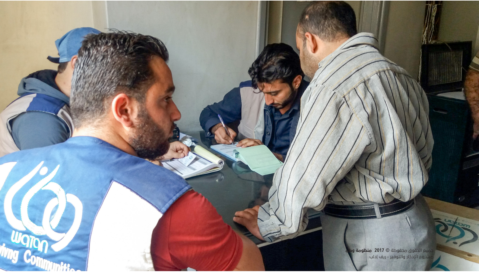
جميع الحقوق محفوظة © 2017 منظومة وطن مشروع الإدطار والتوفير - ريف إدلب