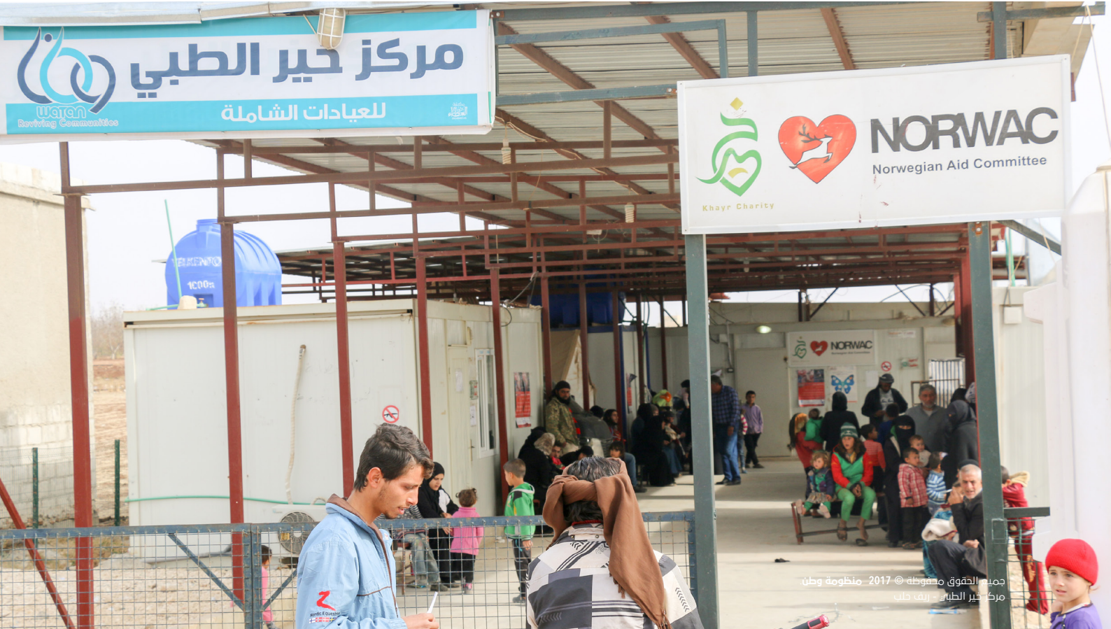
جميع الحقوق محفوظة © 2017 منظومة وطن مركز خير الطبي - ريف حلب