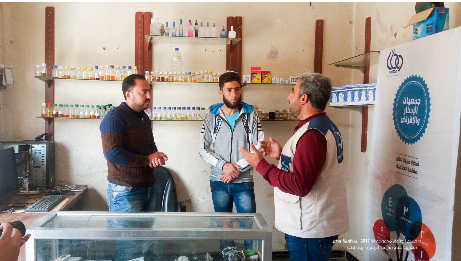
جميع الحقوق محفوظة © 2017 منظومة وطن مشروع دعم مزارعي الزيتون - ريف إدلب