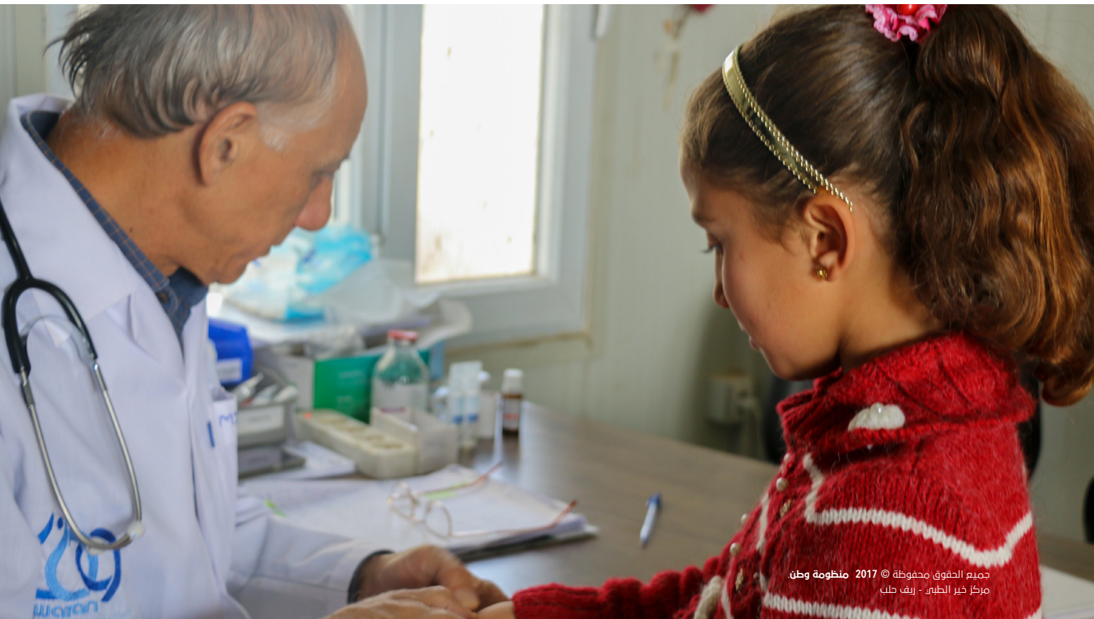
جميع الحقوق محفوظة © 2017 منظومة وطن مركز خير الطبي - ريف حلب