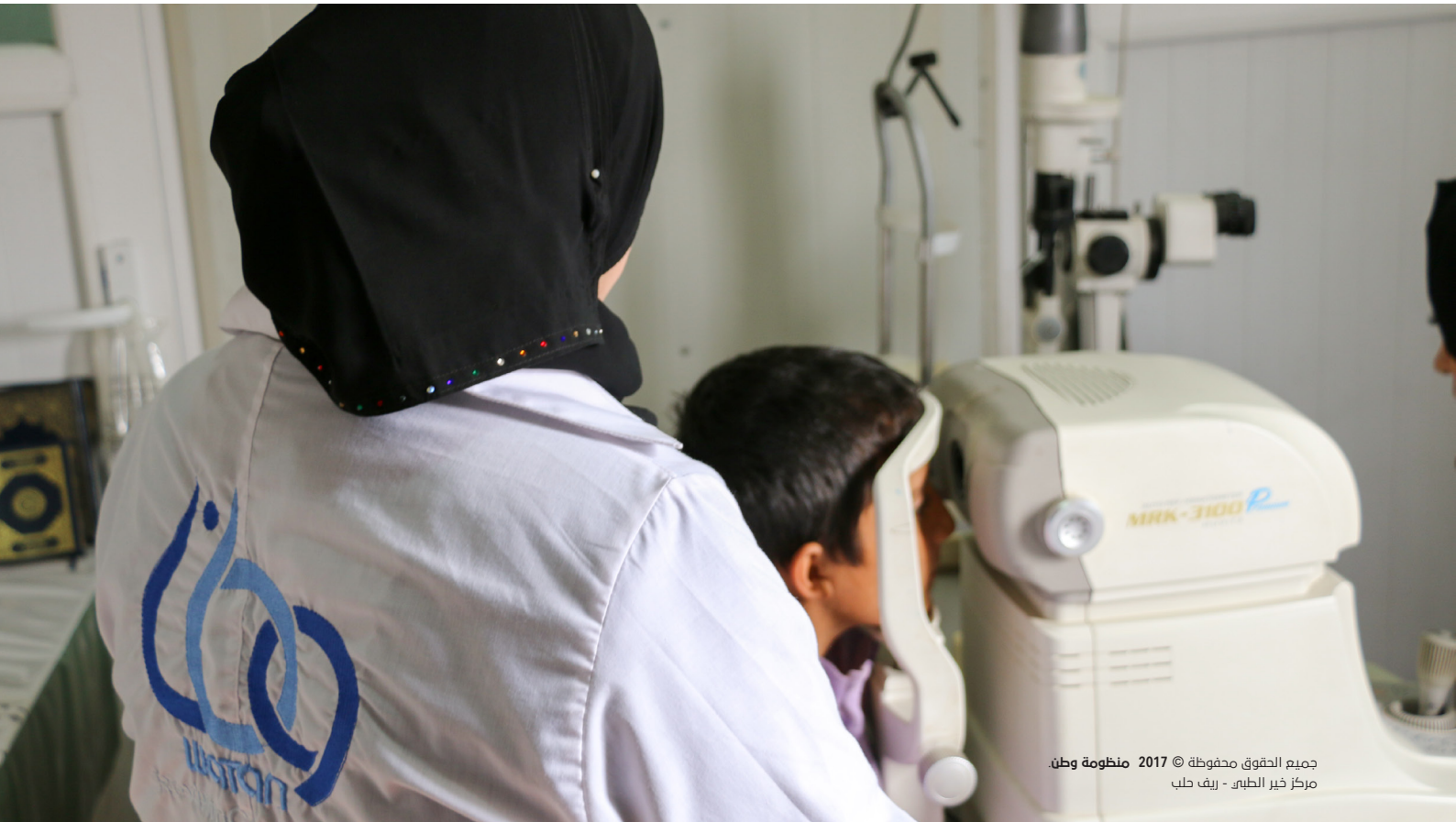
جميع الحقوق محفوظة © 2017 منظومة وطن مركز خير الطبي - ريف حلب